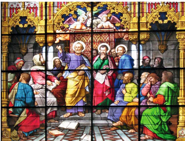
Apostelkonzil, Fenster im Kölner Dom

und deshalb sprechen wir vom Apostelkonzil – um den richtigen Weg der Mission stritten. Um 44 bis 49 nach Christus trafen sich die Apostel der Jerusalemer Urgemeinde und Paulus und Barnabas, die von der Gemeinde Antiochens entsandt waren, um über die sogenannte „Heidenmission“ zu beraten, zentral über die Frage, ob Heiden sich erst beschneiden lassen müssten, um Christen zu werden. Die Ergebnisse sind festgehalten in der Apostelgeschichte (Apg 15,1-29) und im Brief des Paulus an die Galater (Gal 2,1-10): Eine Beschneidung war nicht mehr vonnöten, um Christ zu werden; vielmehr betonte Petrus, dass alle allein durch den Glauben gerettet werden. Die in der Apostelgeschichte genannten zu beachtenden Speisevorschriften nennt Paulus im Galaterbrief nicht und sie spielten offensichtlich auch keine große Rolle. Spätestens mit dem Apostelkonzil festigte sich das Selbstverständnis der Christen als Gemeinschaft aus Juden und Heiden, verbunden durch den Glauben und die Taufe. Der zukünftigen Mission waren keine Grenzen gesetzt. Der Rahmen des Apostelkonzils – gemeinschaftlich zu einer Lösung zu kommen – wurde für die nächsten Jahrhunderte prägend.