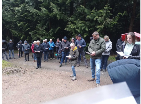
Kreuzweg zum Eickel in Oberhundem am Karfreitag, 29. März 2024