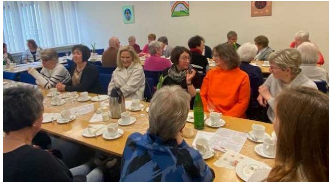
Generalversammlung der kfd Kirchhundem am 16. März